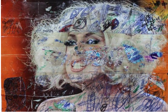
Ermias Kifleyesus, I call and call nobody responds , 2014

Vous pouvez télécharger plus d'images sur www.muhka.be/pers