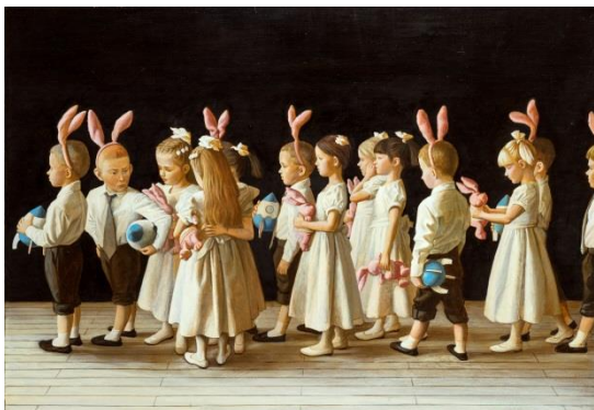
Maria Safronova, The General Outlook Game: New Year , 2013, courtesy of the artist and Gallery Paperworks, Moscow