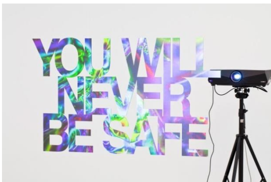
Pennacchio Argentato, YOU WILL NEVER BE SAFE , 2013