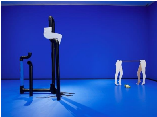
Anthea Hamilton, Installation view of CUT OUTS , 2012

Vous pouvez télécharger plus d'images sur www.muhka.be/pers