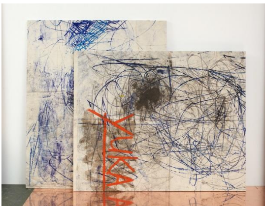
Oscar Murillo, Untitled (stack painting) , 2013