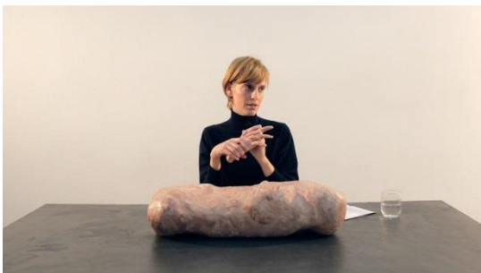
Hedwig Houben, The Hand, the Eye and It , 2013 performance lecture, 20 mins approx